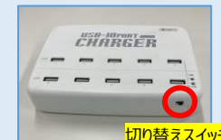
切り替えスイッチ