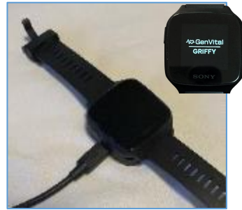
本体を充電器にセット